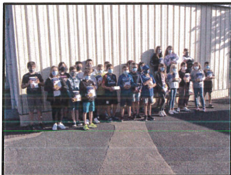
Remise des dictionnaires aux enfants de CM2 passant en 6ème

Renseignement complémentaire ► N° Vert 0 800 875 615 (Appel gratuit depuis un poste fixe).