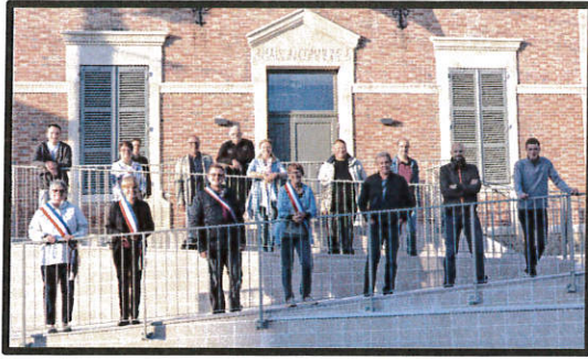
Moncetz - Longevas - N°1 - Septembre à Novembre 2020