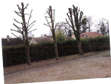
Élagage des tilleuls sur la placette de la Pagerie