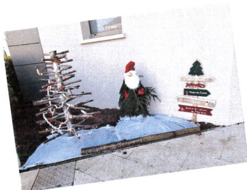
Des décorations de Noël, « fait maison », ont donné un petit air de fête aux rues de notre village.