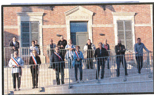
Moncetz - Longevas – N°5 – JANVIER 2022