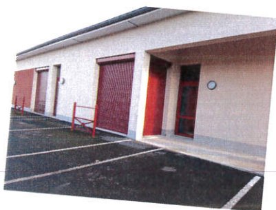
Le P'tit Chez Nous a été partiellement équipé de volets roulants, la suite en 2022.