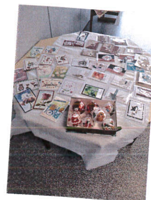
Vente de cartes au profit du Téléthon par les bénévoles du « scrapbooking » pour un montant d'environ 200 €.