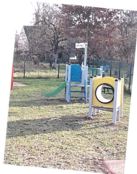
Quatre nouveaux jeux et une petite table de pique-nique ont été installés sur l'aire de jeux pour le plus grand plaisir des tout petits.