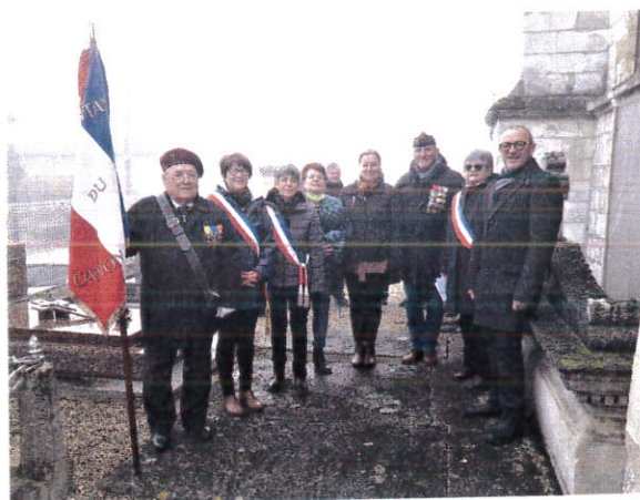
Commémoration du 11 novembre en présence des anciens combattants, des élus et des habitants.