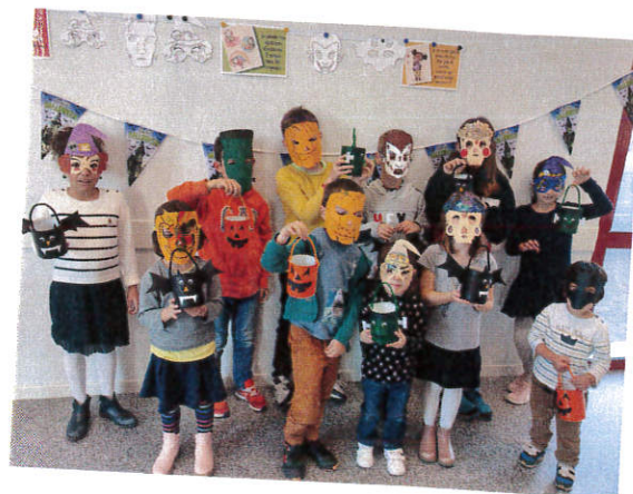
Les enfants de la garderie périscolaire ont fabriqué leur masque et leur panier pour passer dans les rues du village le soir d'Halloween