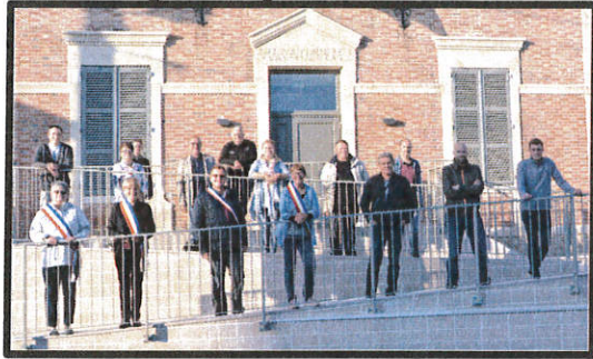
Moncetz - Longevas – N°4 – Octobre 2021